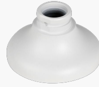
L-HA6 Adapter für Domekameras