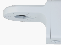
L-WH15 Wandhalter mit Anschlussbox