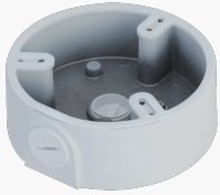
L-AB17 Anschlussbox für Dome-Kameras