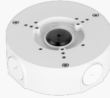
L-AB14 Anschlussbox für Kameras