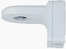
L-WH15 Wandhalter mit Anschlussbox