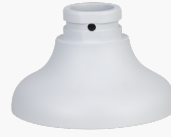
L-HA8 Adapter für Domekameras