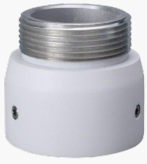
L-HA7 Adapter für Domekameras