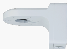
L-WH15 Wandhalter mit Anschlussbox