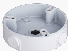
L-AB10 Anschlussbox für Dome-Kameras