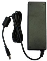
Netzteiler 48 V DC, 1.25 A für L-SW-5700 Netzteiler 48 V DC, 1.25 A