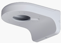
L-WH9 Wandhalter für Dome-Kameras