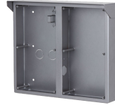
L-RA-5704-AP Aufputzrahmen für Modular Türstationen