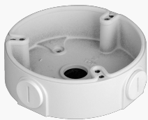
L-AB12 Anschlussbox für Dome-Kameras