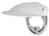
L-WH12 Regenschutz für Dome Kameras