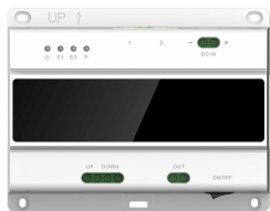
L-SW-5700 2-Draht-Switch für lunaIP Intercom