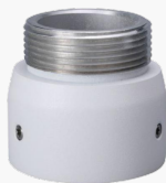
L-HA7 Adapter für Domekamas