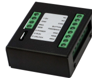
L-ER-5020 Türsprechanlagen Erweiterungsmodul