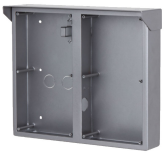
L-RA-5704-AP Aufputzrahmen für Modular Türstationen