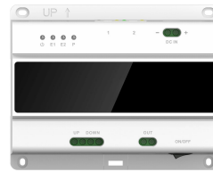
L-SW-5700 2-Draht-Switch für lunaIP Intercom